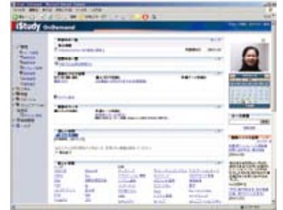
iStudy OnDemand トップページ

学習者は、学習することはもちろん、過去に受けたテストのスコアや、学習コンテンツの進捗状況を確認できます。